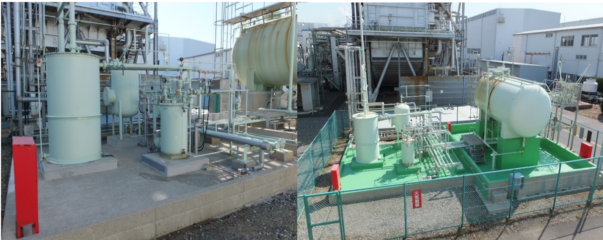
■ 工事名:日立製作所臨海工場 薬液堤保護塗装工事 ■ 施工年:2013年 ■ 施工場所:茨城県 ■ 施工数量:200㎡ ■ 目的:コンクリート改質・表面保護(クリスタルストーンNR併用)