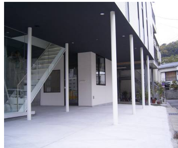
■ 工事名:M's邸新築工事 ■ 施工年:2010年 ■ 施工場所:長崎県 ■ 施工数量:8㎡ ■ 目的:鉄骨丸柱 美装及び美観保持(下塗り:一般錆止め使用)