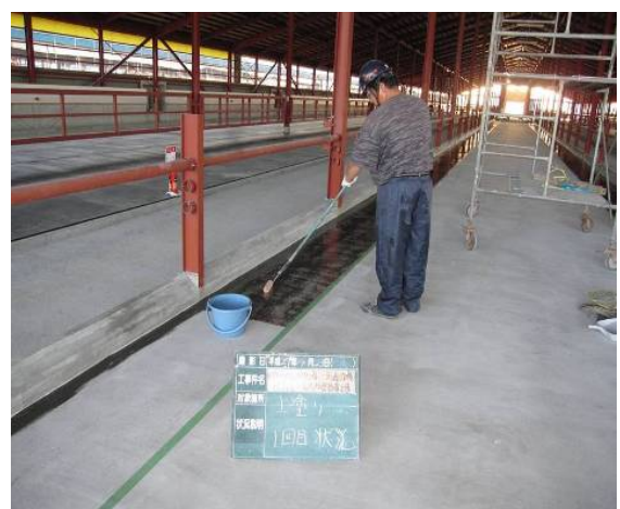
■ 工事名:宗谷岬牧場天塩分場肥育素牛育成牛舎新築工事 ■ 施工年:2009年 ■ 施工場所:北海道 ■ 施工数量:294㎡ ■ 目的:飼槽土間コンクリート(クリスタルストーンNR併用)