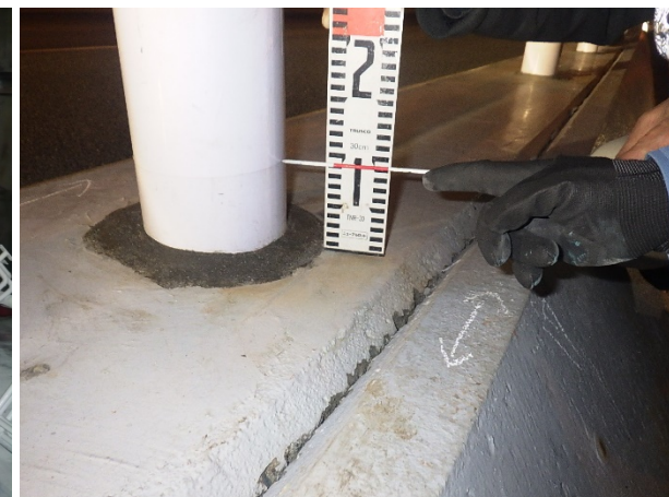
■ 工事名:西公園~百道防護柵補修工事(30-1) ■ 施工年:2019年 ■ 施工場所:福岡県 ■ 施工数量:337㎡ ■ 目的:高速道路防護柵鋼製支柱地際腐食対策