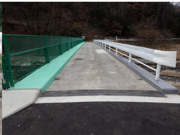
■ 工事名:平成29年度防災・安全交付金事業 切久保橋修繕工事 ■ 施工年:2017年 ■ 施工場所:長野県 ■ 施工数量:120㎡ ■ 目的:落石防護柵(既設)防錆