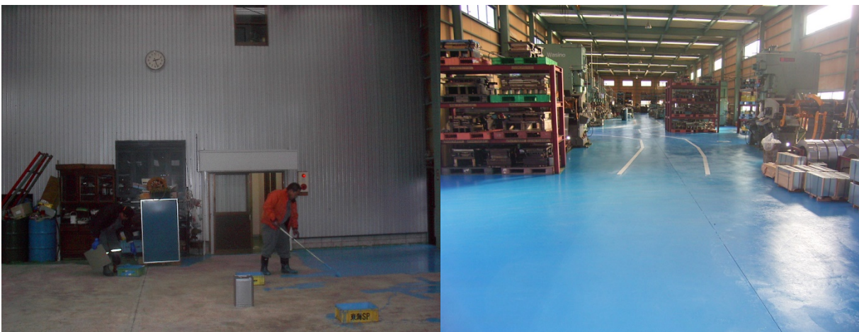
■ 工事名:U総業床面修繕工事 ■ 施工年:2009年 ■ 施工場所:岐阜県 ■ 施工数量:500㎡ ■ 目的:土間コンクリート劣化防止・着色