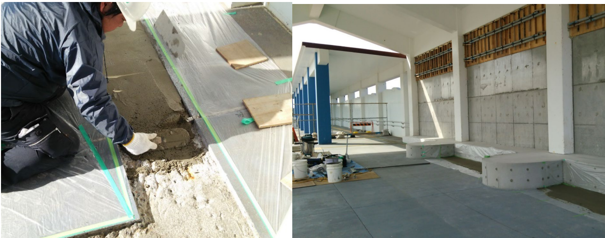
■ 工事名:平成27年度新島港日除け雨除け施設及びその他改修工事 ■ 施工年:2017年 ■ 施工場所:東京都 ■ 施工数量:5㎡ ■ 目的:不陸調整(シールコート007R併用)