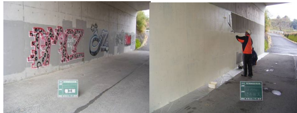
■ 工事名:和田平線落書消去及び防止工事 ■ 施工年:2007年 ■ 施工場所:鹿児島県 ■ 施工数量:50㎡ ■ 目的:不陸調整(テリオスコート美装防汚工法併用)