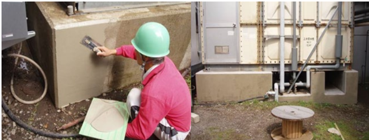
■ 工事名:NEC玉川事業場 72号館受水槽基礎劣化防止塗装工事 ■ 施工年:2010年 ■ 施工場所:神奈川県 ■ 施工数量:40㎡ ■ 目的:ひび割れ補修、不陸調整(T&C防食併用)