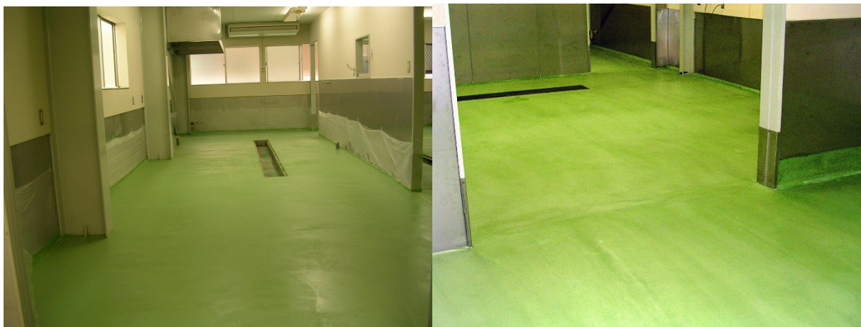
■ 工事名:食品加工工場改修工事 ■ 施工年:2007年 ■ 施工場所:石川県 ■ 施工数量:180㎡ ■ 目的:不陸調整(クリスタルストーンNR併用)