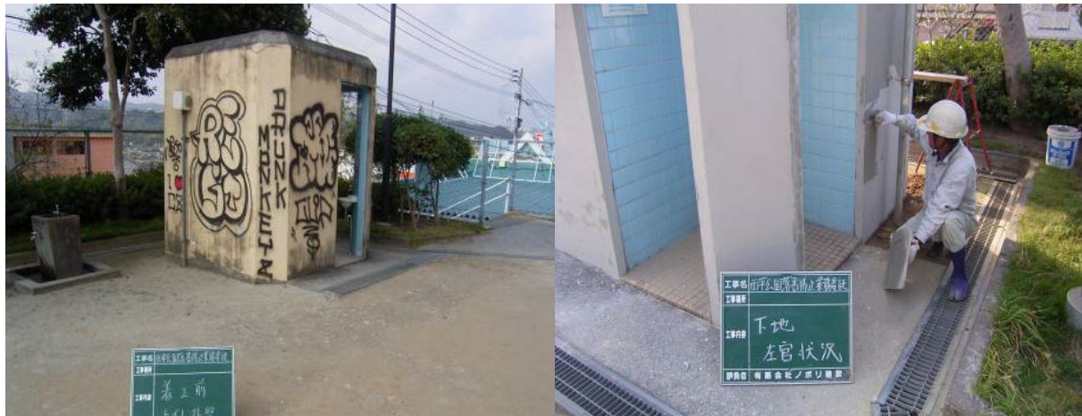
■ 工事名:西平公園落書防止工事 ■ 施工年:2006年 ■ 施工場所:鹿児島県 ■ 施工数量:18㎡ ■ 目的:不陸調整(テリオスコート美装防汚工法併用)