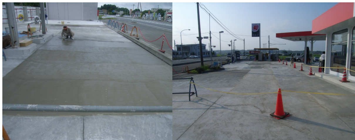
■ 工事名:ガソリンスタンド改修工事 ■ 施工年:2009年 ■ 施工場所:福島県 ■ 施工数量:290㎡ ■ 目的:不陸調整