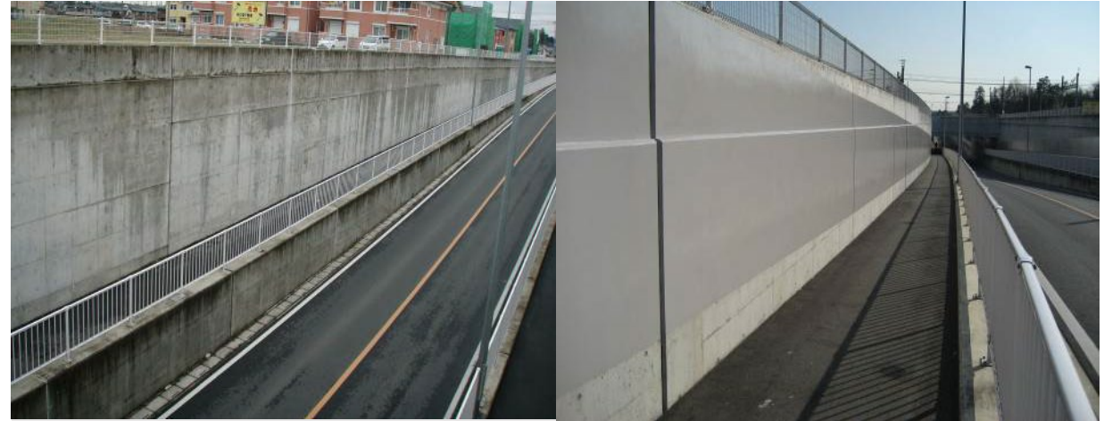
■ 工事名:滑川高校西通線落書防止工事 ■ 施工年:2006年 ■ 施工場所:埼玉県 ■ 施工数量:800㎡ ■ 目的:不陸調整(テリオスコート美装防汚工法併用)