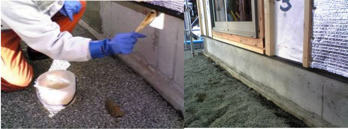
■ 工事名:横浜市A様邸新築工事 ■ 施工年:2007年 ■ 施工場所:神奈川県 ■ 施工数量:16㎡ ■ 目的:住宅基礎コンクリート劣化対策