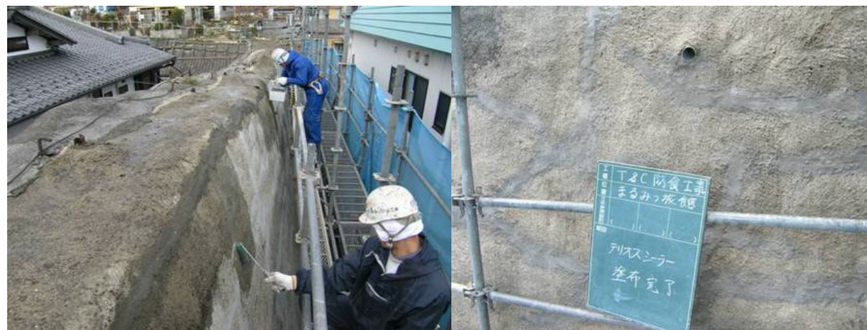
■ 工事名:まるみつ旅館擁壁防食塗装工事 ■ 施工年:2009年 ■ 施工場所:茨城県 ■ 施工数量:700㎡ ■ 目的:擁壁コンクリート凍害対策