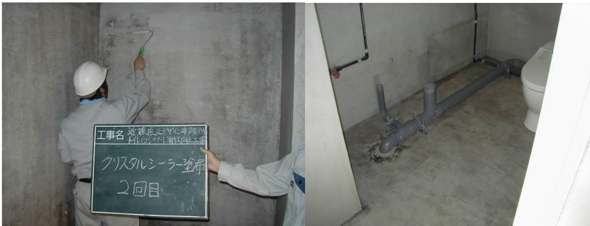
■ 工事名:近藤康夫デザイン事務所トイレ耐久性向上工事 ■ 施工年:2005年 ■ 施工場所:東京都 ■ 施工数量:20㎡ ■ 目的:トイレ内コンクリート部材