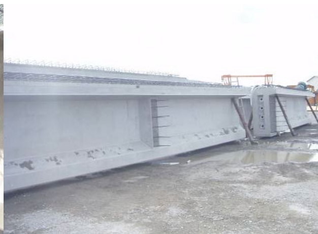
■ 工事名:平成18年度153号線上穂沢川橋PC上部工事 ■ 施工年:2007年 ■ 施工場所:長野県 ■ 施工数量:1000㎡ ■ 目的:上部工塩害対策