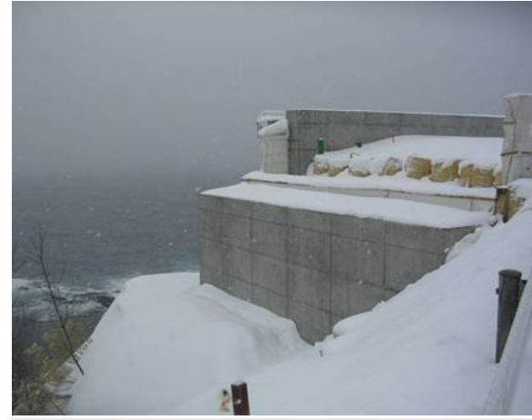
■ 工事名:一般国道229号神恵内村 魚谷改良工事 ■ 施工年:2004年 ■ 施工場所:北海道 ■ 施工数量:220㎡ ■ 目的:橋台コンクリート塩害対策