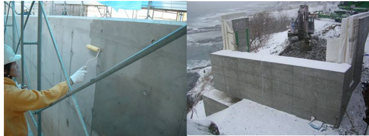
■ 工事名:一般国道229号神恵内村 祈石橋橋台工事 ■ 施工年:2004年 ■ 施工場所:北海道 ■ 施工数量:270㎡ ■ 目的:橋台コンクリート塩害対策