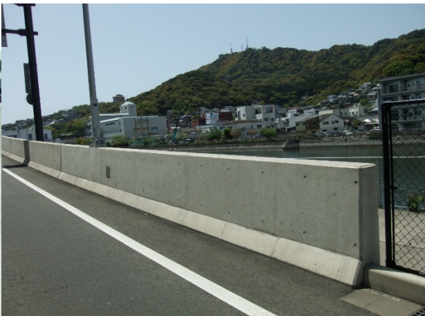
■ 工事名:浦上川線(P6~P7)高架橋床版防食工事 ■ 施工年:2010年 ■ 施工場所:長崎県 ■ 施工数量:840㎡ ■ 目的:コンクリート床版塩害対策、壁高欄(試験施工)