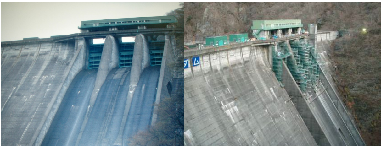
■ 工事名:五十里ダム改修工事 ■ 施工年:2006年 ■ 施工場所:栃木県 ■ 施工数量:1550㎡ ■ 目的:クレストゲート補修工事(凍害対策)