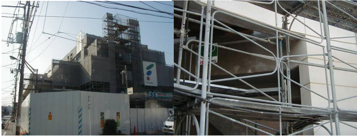
■ 工事名:敬仁病院新築工事 ■ 施工年:2004年 ■ 施工場所:東京都 ■ 施工数量:100㎡ ■ 目的:外壁ほか劣化対策・防汚