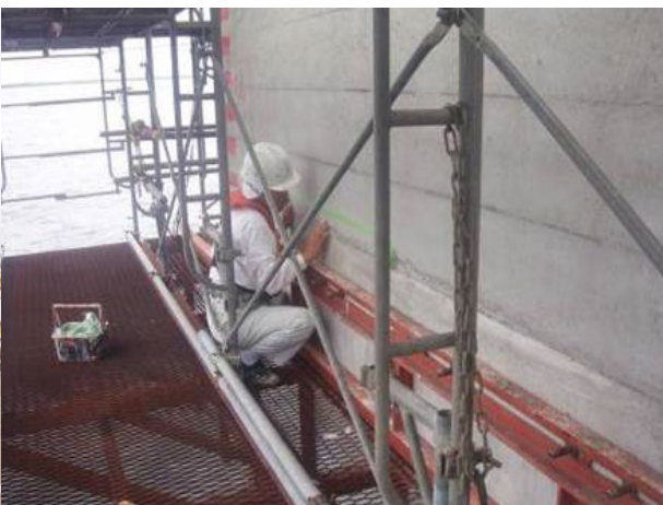
■ 工事名:平成20年度小名浜港東地区護岸(防波)本体工事 ■ 施工年:2008年 ■ 施工場所:福島県 ■ 施工数量:不明 ■ 目的:ケーソン打ち継ぎ部塩害対策