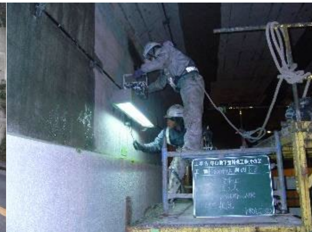
■ 工事名:中山地下道補修工事(その3) ■ 施工年:2015年 ■ 施工場所:鹿児島県 ■ 施工数量:531㎡ ■ 目的:劣化因子侵入抑止