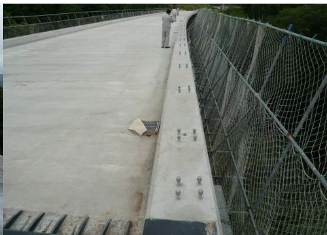
■ 工事名:一般国道275号幌加内町外幌加内峠改良工事 ■ 施工年:2009年 ■ 施工場所:北海道 ■ 施工数量:不明 ■ 目的:コンクリート部材凍害対策(予防保全)