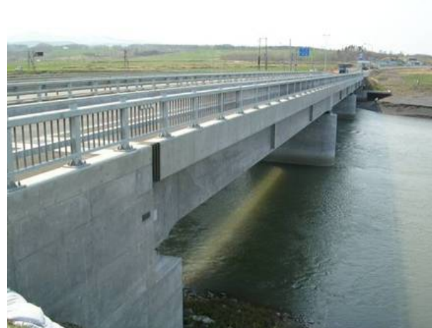
■ 工事名:一般国道238号雄武町幌内橋上部工事 ■ 施工年:2006年 ■ 施工場所:北海道 ■ 施工数量:417㎡ ■ 目的:地覆部塩害対策