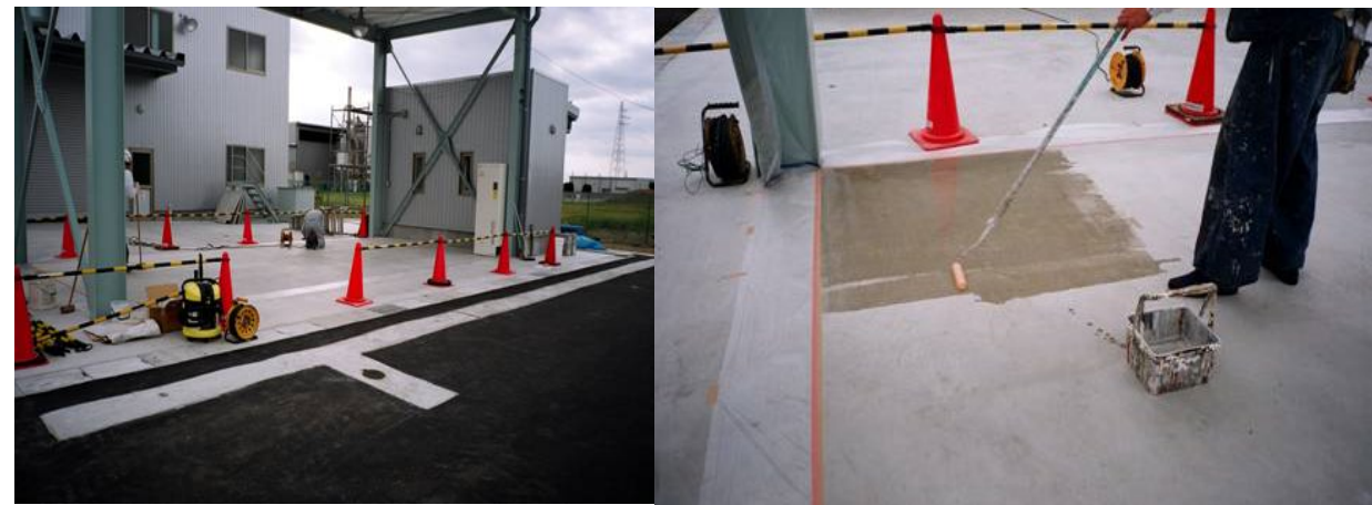
■ 工事名:富山BDF(株)新設工事 ■ 施工年:2006年 ■ 施工場所:富山県 ■ 施工数量:30㎡ ■ 目的:ストックヤード劣化対策(防塵など)