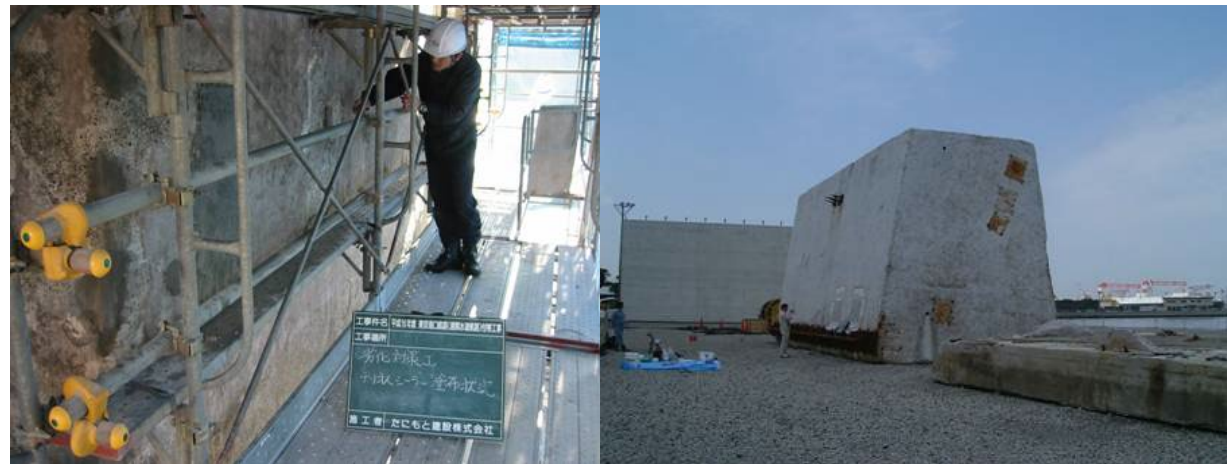
■ 工事名:東京湾口航路(浦賀水道航路)付帯工事 ■ 施工年:2005年 ■ 施工場所:神奈川県 ■ 施工数量:178㎡ ■ 目的:ケーソン劣化対策