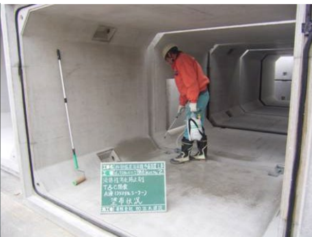
■ 工事名:和田塩屋海岸線歩道設置工事 ■ 施工年:2007年 ■ 施工場所:鹿児島県 ■ 施工数量:160㎡ ■ 目的:ボックスカルバート内部劣化対策