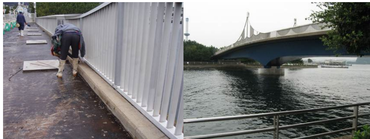
■ 工事名:金沢八景島下水道等改良工事 ■ 施工年:2008年 ■ 施工場所:神奈川県 ■ 施工数量:不明 ■ 目的:地覆部など塩害対策