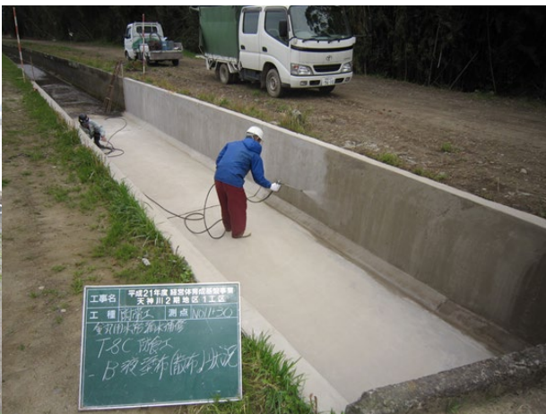
■ 工事名:金丸用水路補修工事 ■ 施工年:2010年 ■ 施工場所:宮崎県 ■ 施工数量:180㎡ ■ 目的:水路補修・劣化因子浸入抑止