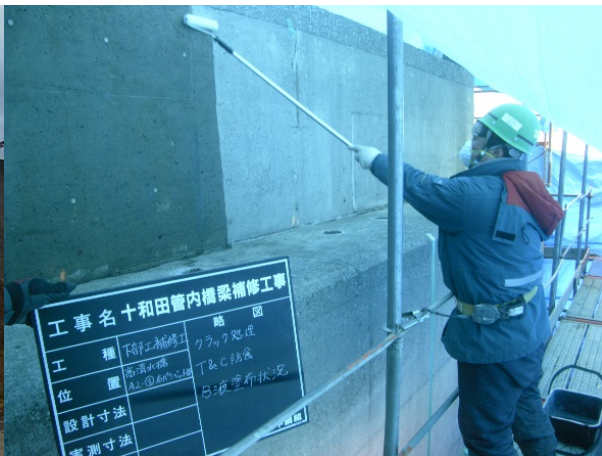
■ 工事名:十和田管内橋梁維持工事 ■ 施工年:2014年 ■ 施工場所:青森県 ■ 施工数量:532㎡ ■ 目的:ひび割れ(0.2mm未満)対策、凍害対策