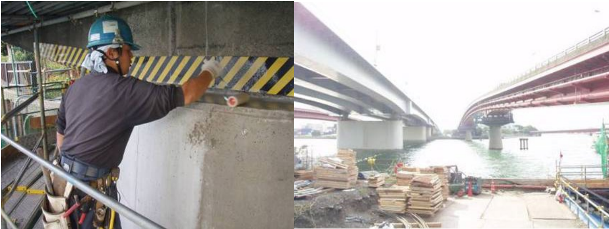
■ 工事名:京浜大橋改修工事 ■ 施工年:2016年 ■ 施工場所:東京都 ■ 施工数量:100㎡ ■ 目的:橋台劣化対策