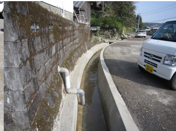
■ 工事名:平成21年度丸目地区排水路改良工事 ■ 施工年:2010年 ■ 施工場所:宮崎県 ■ 施工数量:180㎡ ■ 目的:水路補修、下地3軸メッシュシート補強工、モルタル仕上げ