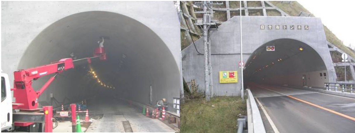
■ 工事名:一般国道231号増毛町 日方泊トンネル新設工事 ■ 施工年:2004年 ■ 施工場所:北海道 ■ 施工数量:434㎡ ■ 目的:トンネル内コンクリート塩害対策工事