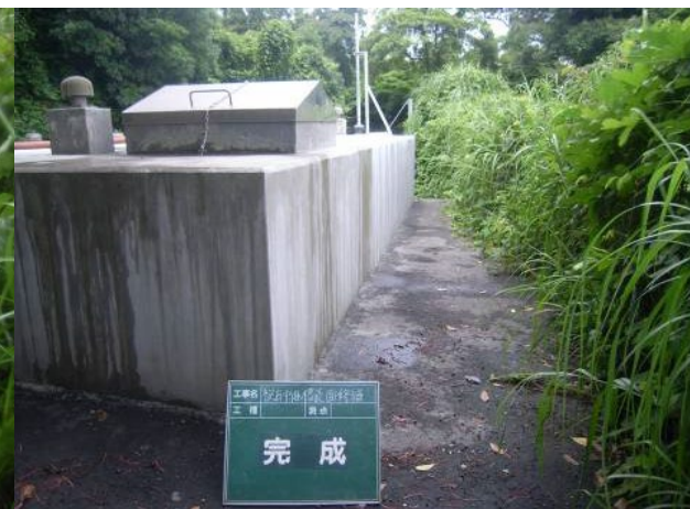
■ 工事名:桜島中継層修繕工事 ■ 施工年:2008年 ■ 施工場所:鹿児島県 ■ 施工数量:不明 ■ 目的:コンクリート部材劣化対策