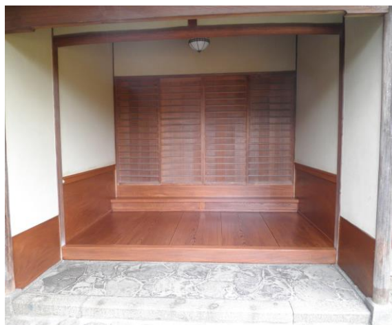
■ 工事名: 料亭橋本玄関修繕工事 ■ 施工年: 2011年 ■ 施工場所: 長崎県 ■ 施工数量: 15㎡ ■ 目的: 玄関縁板美装及び美観保持