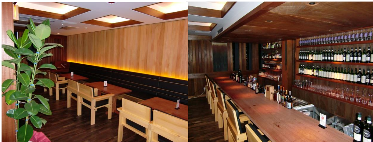
■ 工事名: 東京大学ファカルティハウス新築工事 ■ 施工年: 2009年 ■ 施工場所: 東京都 ■ 施工数量: ■ 目的: 内装木部 着色・保護コート