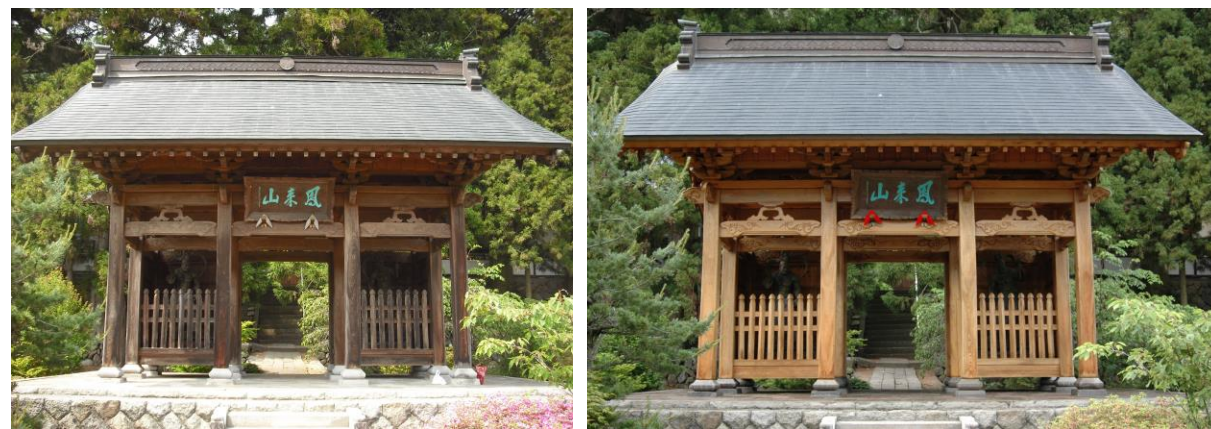
■ 工事名: 龍興寺塗装工事 ■ 施工年: 2009年 ■ 施工場所: 長野県 ■ 施工数量: 不明 ■ 目的: 門(木部) 復元・耐久ガラスコーティング工事