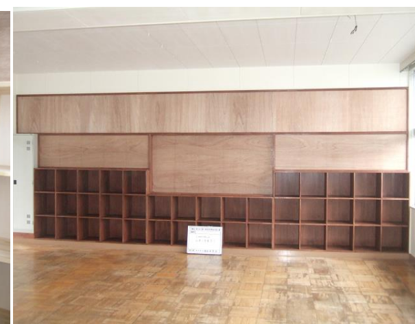
■ 工事名: 県立日立第一高等学校床改修工事 木製ロッカ-塗装 ■ 施工年: 2012年 ■ 施工場所: 岐阜県 ■ 施工数量: 146㎡ ■ 目的: 木材表面保護、着色