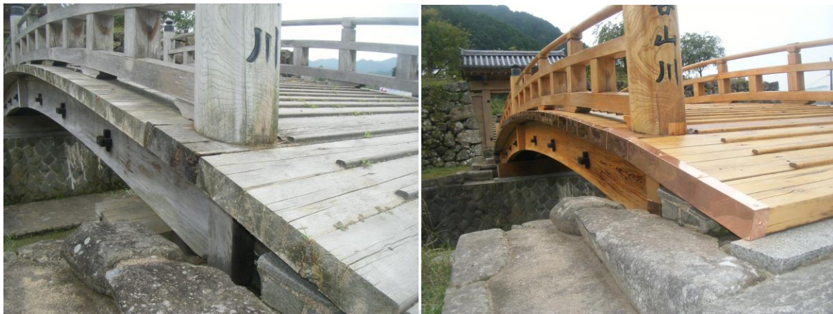
■ 工事名: 登城橋塗装工事 木製橋 保護コート ■ 施工年: 2009年 ■ 施工場所: 兵庫県 ■ 施工数量: 不明 ■ 目的: 木製橋 保護コート