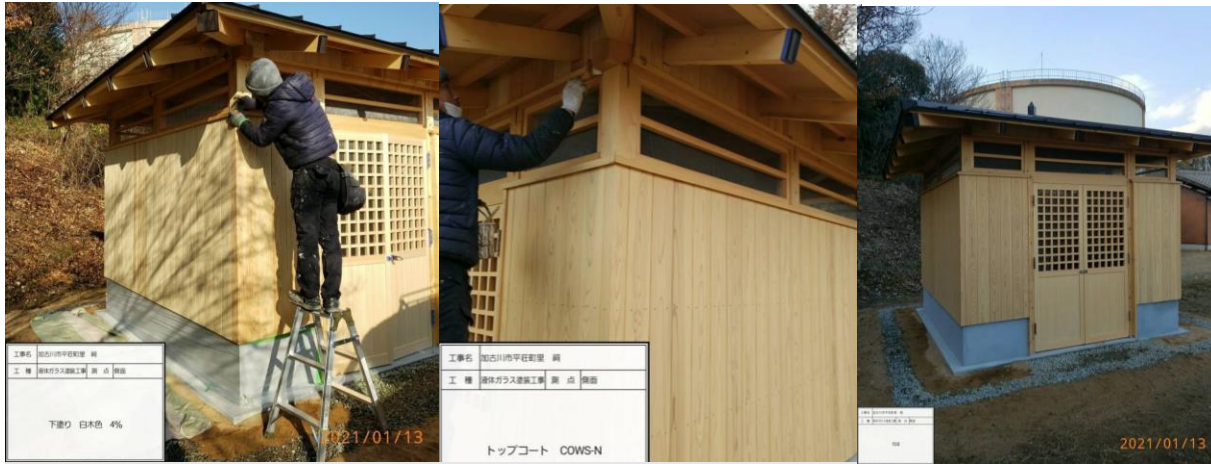
工事名 加古川市平荘町里 祠 工種 液体ガラス塗装工事 業 点 別冊 下塗り 日付色 4% 2021/01/13 トップコート COWS-N