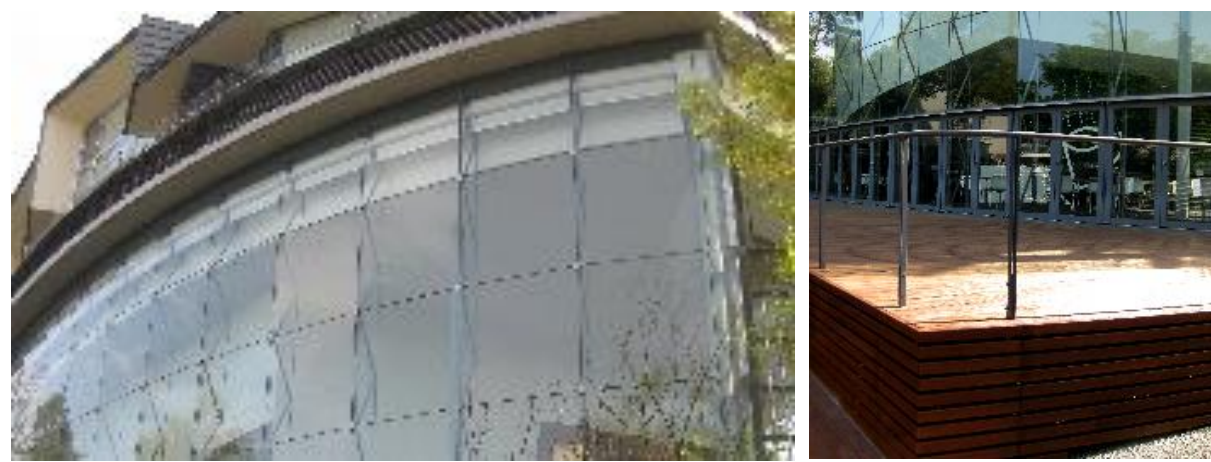
■ 工事名: 名古屋大学野依教授ノーベル化学賞受賞記念館 ■ 施工年: 2010年 ■ 施工場所: 愛知県 ■ 施工数量: 不明 ■ 目的: 木材デッキ保護 美装