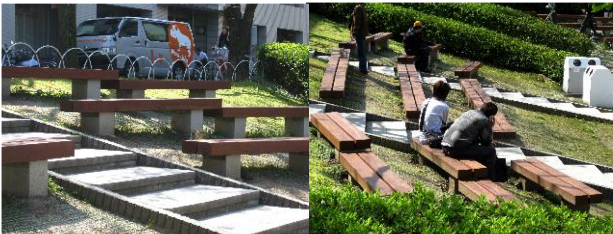
■ 工事名: 名古屋大学外構塗装工事 ■ 施工年: 2010年 ■ 施工場所: 愛知県 ■ 施工数量: 不明 ■ 目的: 木製ベンチ 保護 美装