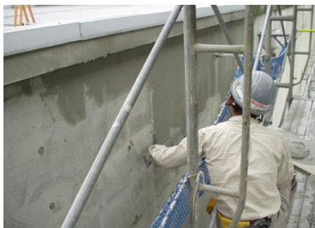
〈薄付け仕上げ状況〉