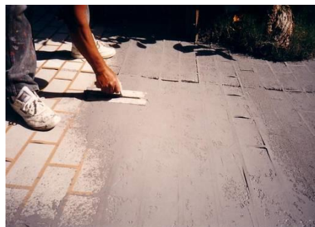
〈パターン仕上げ状況〉