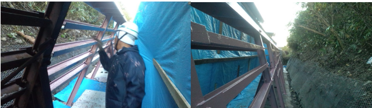
■ 工事名:日向地区小規模治山工事 ■ 施工年:2011年 ■ 施工場所:北海道 ■ 施工数量:80㎡ ■ 目的:落石防護柵(既設)防錆