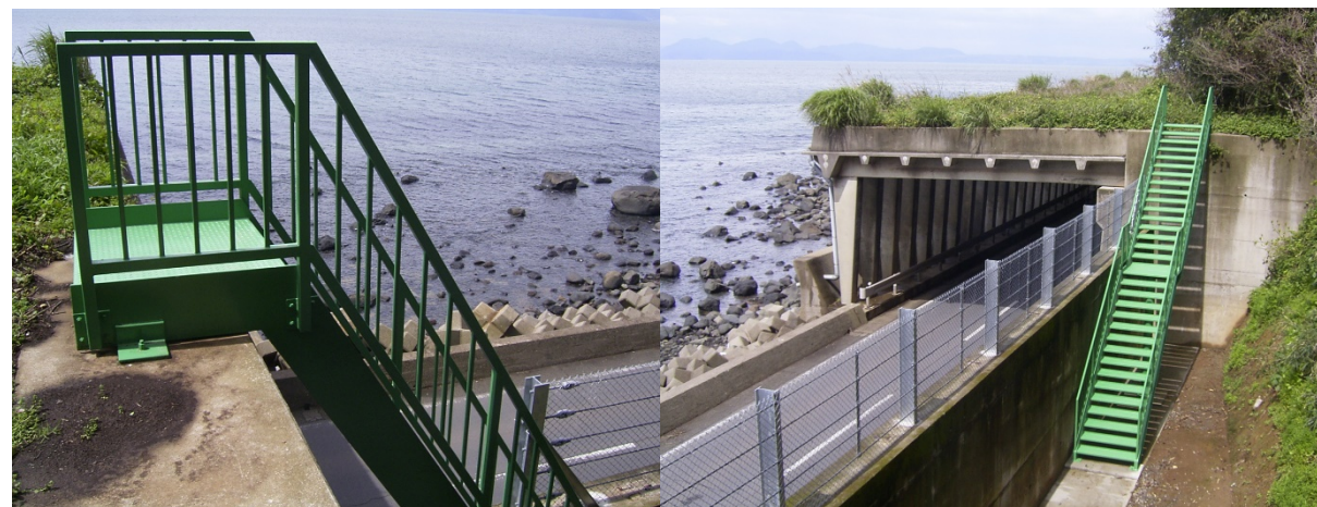
■ 工事名:一般国道251号道路災害防除工事 ■ 施工年:2010年 ■ 施工場所:長崎県 ■ 施工数量:391㎡ ■ 目的:鉄骨階段 防錆