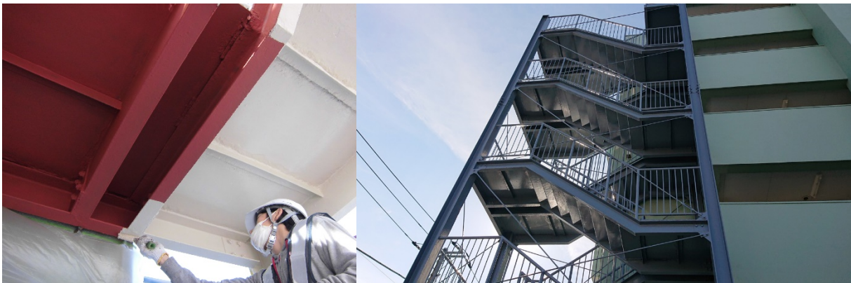
■ 工事名:集合住宅鉄骨階段塗装工事 ■ 施工年:2018年 ■ 施工場所:東京都 ■ 施工数量:350㎡ ■ 目的:鉄骨階段(既設)補修・防錆